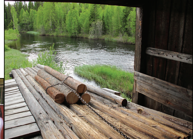
Ramsågen från slutet av 1800-talet i Långbo väckte intresse och vacker var vyn från det gamla såghuset.